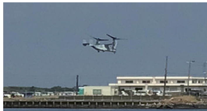
木更津駐屯地から飛びたつオスプレイ (8月26日)