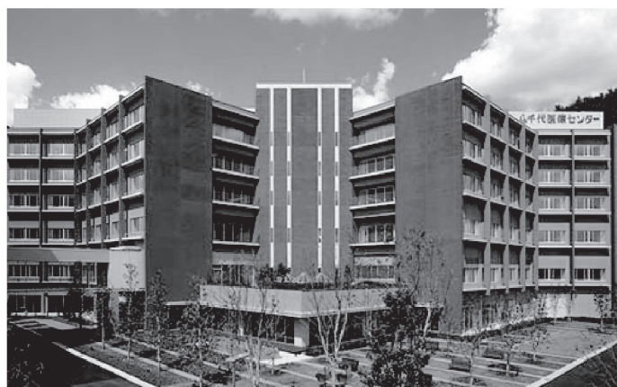
このままでは医療崩壊に向かう医療センター

八千代市は2000年に東京女子医大病院の誘致を開始。八千代医療センターは八千代市の中核病院であり、市民病院として位置づけられて運営されています。しかし、誘致をめぐって当時から問題がありました。学習会では八千代医療センター問題の今について報告します。